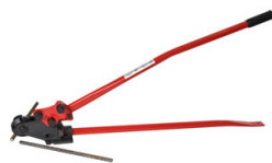
Baustahl- Schneide- und Biegewerkzeug